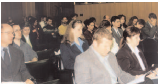
A szimpózium résztvevői a dékáni tanácsteremben, amely a rendezvény színhelye volt

s z í v i z o m prekondi- cionálás el- méleti hátte- réről és a- zokról a lé- pésekről, melyek a klinikai al- kalmazás fe- lé már eddig megtörtén-