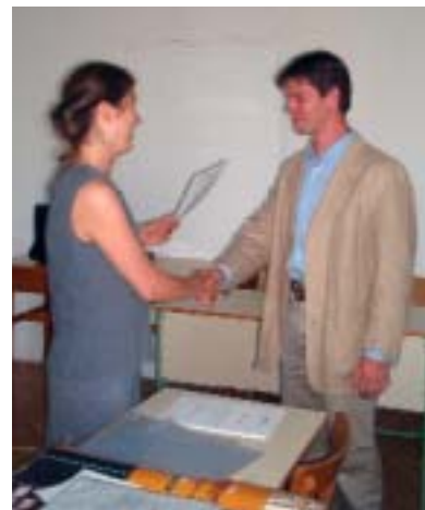
Rab Virág szakkollégium-vezető gratulál az egyik díjazott előadónak

A Grastyán Endre Szakkollégium tagságának nevében