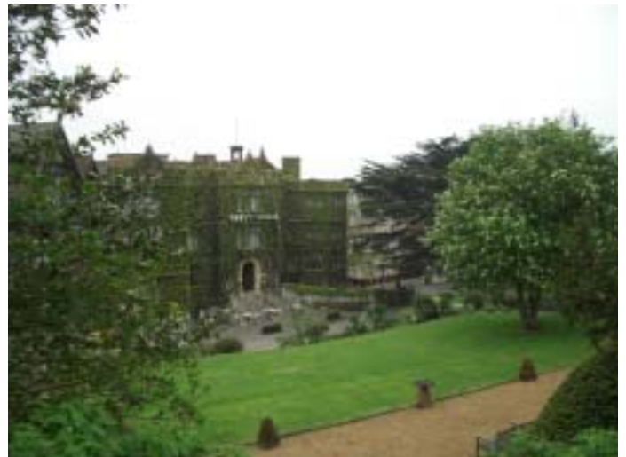
A DIABETIC FOOT Konferencia egyik helyszíne

Ahogy a záróünnepségen elhangzott, az elmúlt 20 év alatt nagyon sok minden történt a világban, azonban az egyértelművé