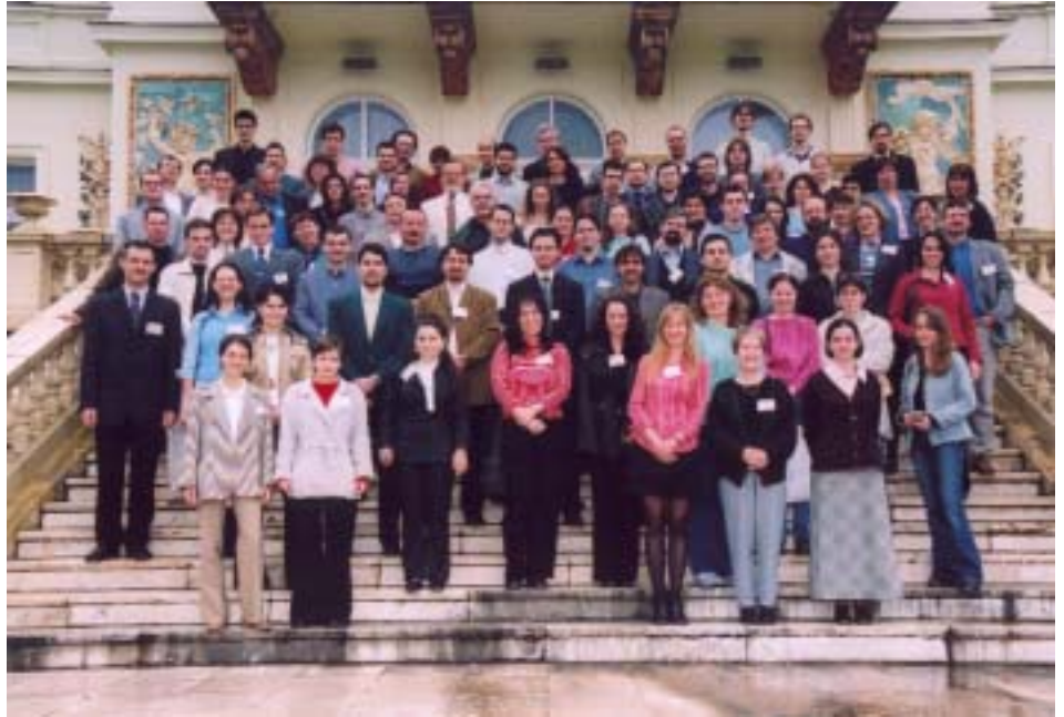
A rendezvény résztvevőinek egy csoportja az Akadémiai Székház lépcsőin